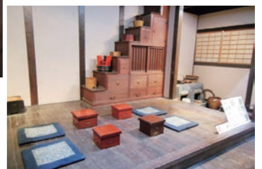
江戸時代の商家や武家屋敷を復元したスペースを見学できる。

テーマは「城下町広島街の発展と暮らし」。再現された武家屋敷や、江戸時代の町並みが描かれた広島城下絵屏風で、当時の人々の暮らしを垣間見ることができる。