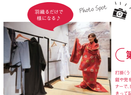
羽織るだけで様になる♪

Event 新春！江戸時代の富くじ体験 1/13(月・祝)には、江戸時代に宮島で広島藩宮のもと開催された「富くじ」を体験できるイベントを開催(先着順)。参加者には空くじなしの広島城オリジナルグッズのプレゼントもあり！