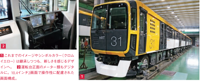
これまでのイメージやシンボルカラー(クロムイエロー)は継承しつつも、新しさを感じるデザインへ。運転台正面のメーター類もデジタルに。10.4インチ2画面で操作性に配慮された画面構成。

アストラムラインの新型車両1編成(6両)が10月4日、車両基地に 搬入された。現在の全24編成を10年以上かけて新しい車両に入れ 替える予定の第1弾で、検査や試運転などを重ね、来春デビュー する予定。新型車両は車体をアルミ製にして軽量化し、走行に必要 な電力量を減らすなどして省エネ性をUP。さらに車椅子やベビー カーでも使いやすいフリースペースを増やすなど、バリアフリーに考慮。 デビューの日程は決まり次第ホームページ (http://astramline.co.jp/) へUP予定。