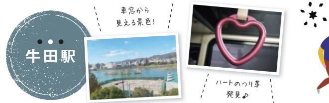
車窓から見える景色！