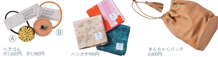
ヘアゴム A ①1,650円、②1,980円

広島市東区牛田旭1-8-17 ☎082-555-8155 図 美容室/9:00～19:00 (最終受付18:00) 雑貨店/10:00～17:00 困 美容室/月、第1火、第3日 雑貨店/日、月、第1火 (変動あり) 図 2台