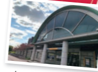
駅舎がカッコイイ！

広島市中区上八丁堀3-12-B1F ☎082-221-3884 図 12:00～15:30、18:30～23:00 ※要予約、コースのみの営業、月曜はランチ営業なし 図 日