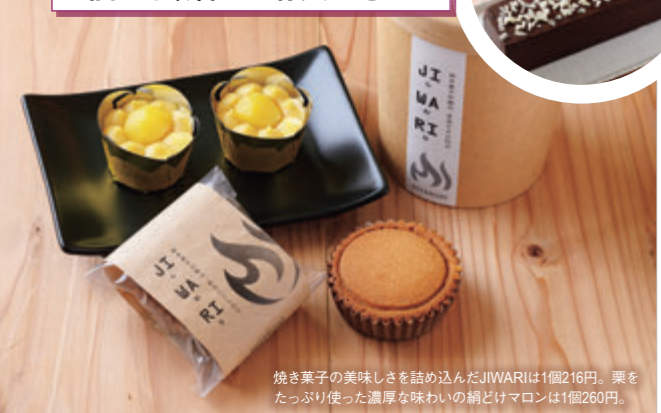
焼き菓子の美味しさを詰め込んだJIWARIは1個216円。栗をたっぷり使った濃厚な味わいの網どけマロンは1個260円。