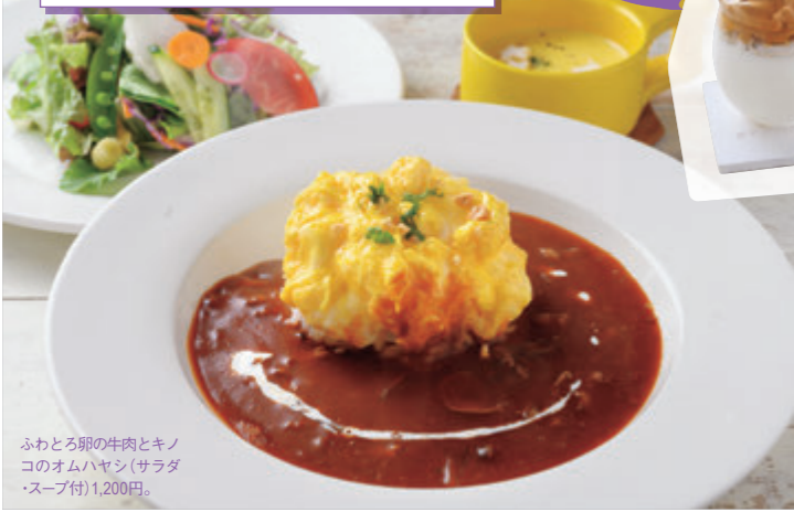
ふわとろ卵の牛肉とキノコのオムハヤシ(サラダ・スープ付)1,200円。