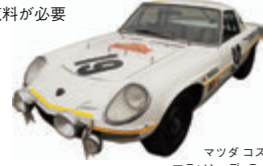
マツダコスモスポーツ マラン・デ・ラルト仕様

長楽寺駅 令和2年度秋季企画展 「マツダとひろしまの100年」 創業100年を迎えたマツダの歩みを、懐かしい車や風景、その時々々の広島の出発点とともに写真や映像で紹介する。 10/8(木)～11/29(日) 2F特別展示室ほか 展示室観覧料が必要