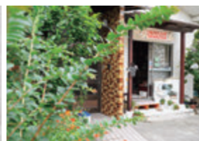
子どものお小遣いで気軽に買える商品が数多くそろう。

広島市安佐南区西原4-30-16 ☎090-6417-2941 圖14:00~18:00 ※火は~19:00. 水・土・日はSNSで要確認 休木・金 閉2台