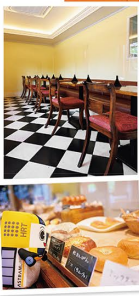
パンの種類がそろうのはお昼前後。フランスパン系は14時ごろに焼き上がる。