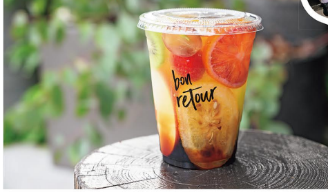
生フルーツティー780円は、しっかりとフルーツを砕いて味わうのが◎。フルーツの食べ応えがあり、デザートのように楽しめるドリンクだ。