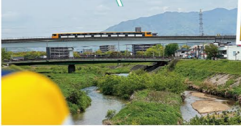
広島フィルム・コミッション(JFC)